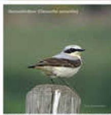
Steinschmätzer In Deutschland ist der Steinschmätzer vom Aussterben bedroht. Dies hat er seiner seltenen Verbreitungsgewohnheit zu verdanken.

Europäisches Vogelschutzgebiet Haardtrand