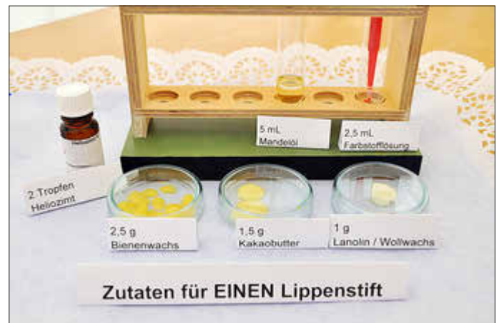
Beispiel: Zutaten für einen Lippenstift.

Am 29.09.2024 findet zwischen 11 Uhr und 16 Uhr im Pfalzmuseum für Naturkunde, POLLICHIA-Museum in Bad Dürkheim die Offene Forschungswerkstatt „Stoffe im Alltag“ statt. Stoffe begegnen uns im Alltag als Nährstoffe, Brennstoffe, Arznei- und Pflegemittel, Farbstoffe, Werkstoffe oder Baustoffe. Die gezielte Verwendung von Stoffen ermöglicht es den Menschen, ihren Alltag zu erleichtern. In verschiedenen Experimenten untersuchen wir die Eigenschaften von Stoffen und ihre Verwendungsmöglichkeiten. Ein Mitmachangebot für alle. Das offene Mitmachprogramm ist für alle Altersgruppen geeignet, die Kosten sind im Museumseintritt enthalten.